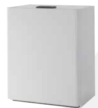
Wärmepumpe Serie WPL